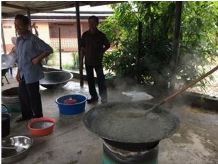
Acara memasak bubur asyura