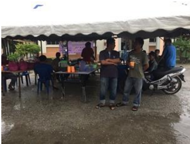
Komuniti tiba seawal jam 8.00 pagi