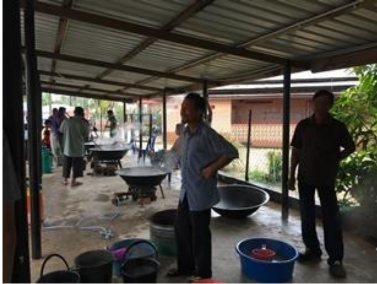
Acara memasak bubur asyura