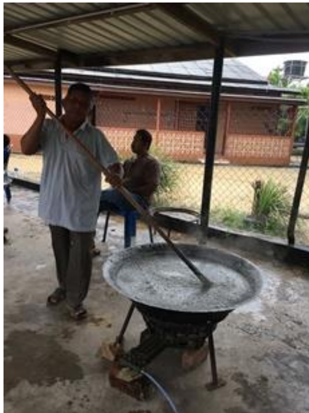
Acara memasak bubur asyura