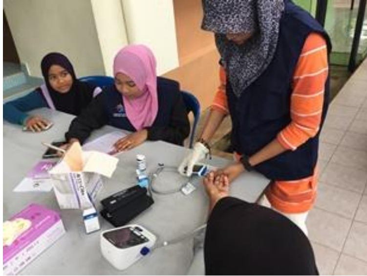
Pemeriksaan kesihatan percuma