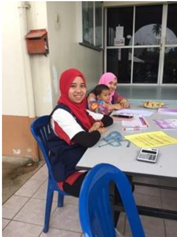
Proses pendaftaran pengunjung oleh Pengurus Pi1M