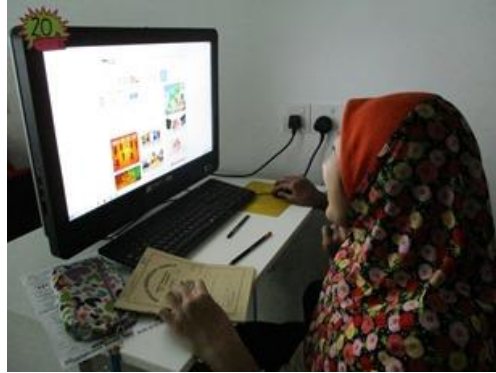
Puzzle Manual Dashboard Komuniti Tarikh: 27/4/2017 Masa: 4.50 – 5.30 petang