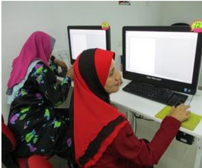
Sesi pembelajaran asas Microsoft Word