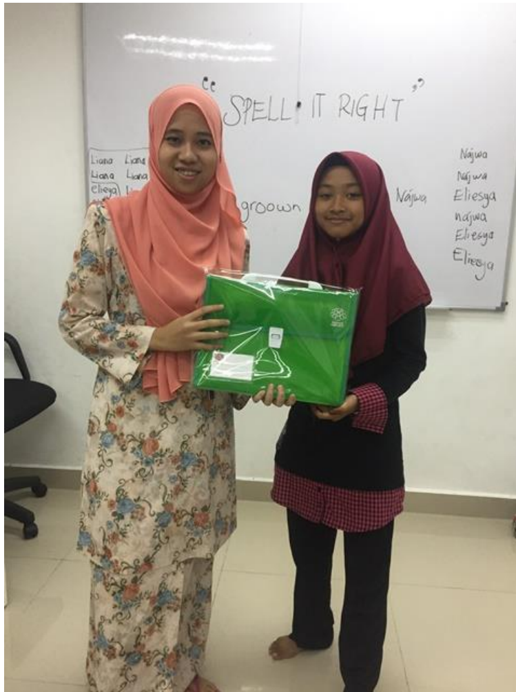
Penyampaian hadiah kepada pemenang