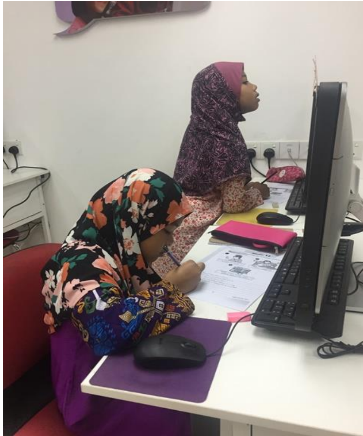
Peserta tekun menjawab soalan karangan Bahasa Inggeris