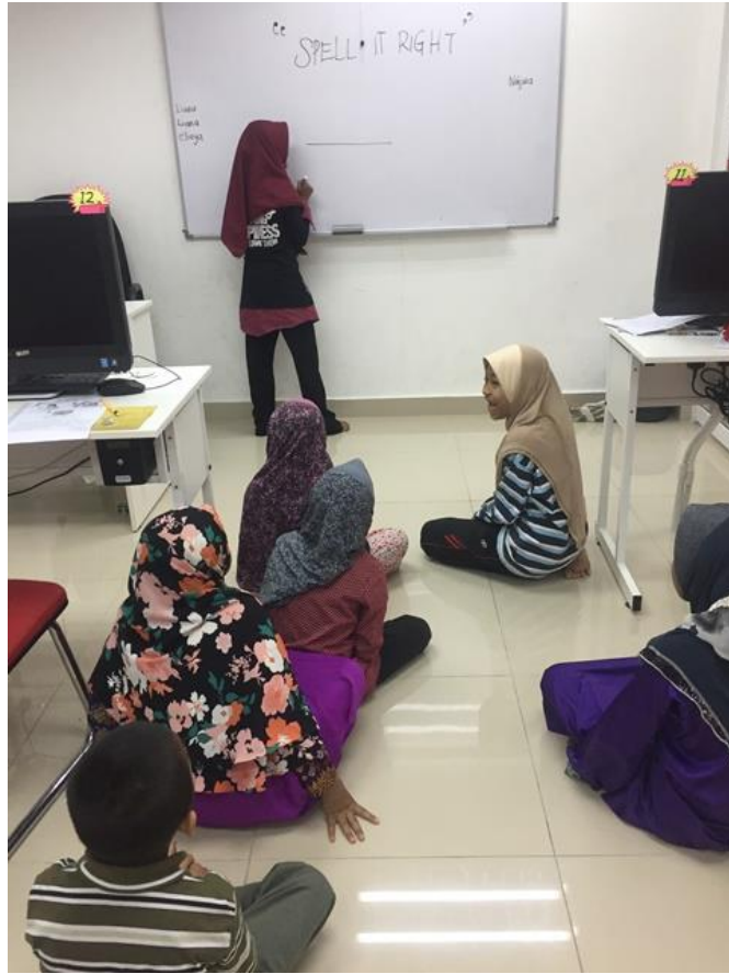
Spell It Right dimulakan