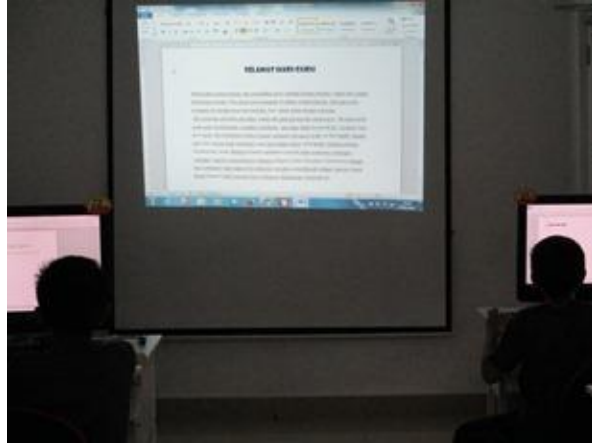
You Tube (Tutorial Origami) Tarikh: 19/5/2017 Masa: 3.30 – 4.30 petang