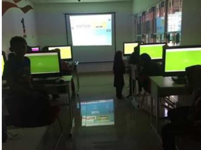
Tayangan animasi Tarikh: 26/5/2017 Masa: 10.00 – 11.00 pagi