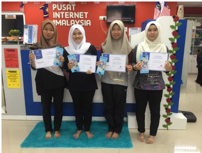
Peserta Latihan Intel Easy Step