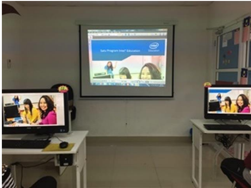
Modul Intel Easy Step