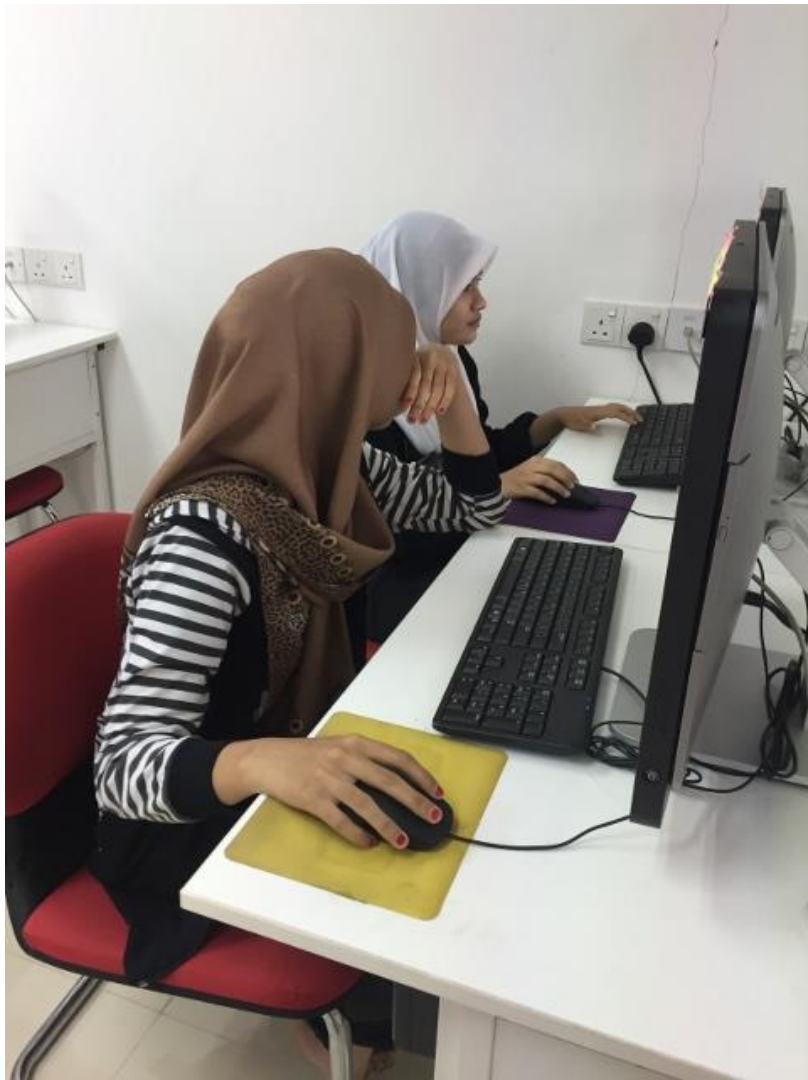
Pelajar memberi perhatian terhadap tugas yang diberi